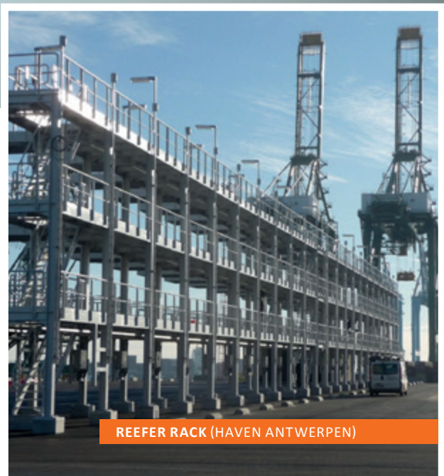
REEFER RACK (HAVEN ANTWERPEN)

Sinds enkele jaren is ZINQ-België en ZINQ-Nederland in het bezit van het Cradle to Cradle certificaat. Thermisch verzinken is niet enkel duurzaam maar ook bijzonder circulair vanwege de zeer lange levensduur die de techniek het staal oplevert en de mogelijkheid die daarmee geboden wordt om het staal veel langer in de kringloop te houden. Het gebruikte zink is dan weer 100% recycleerbaar .